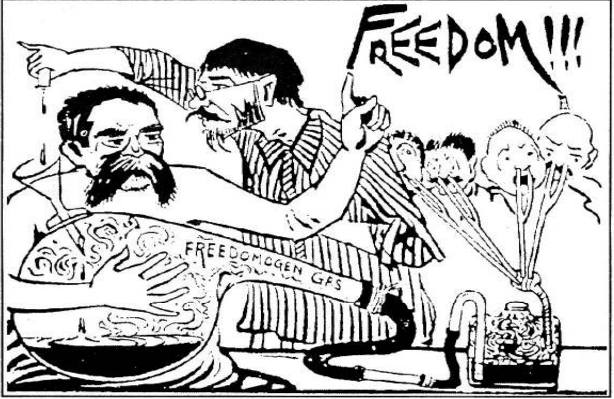
বিশ্ববিদ্যালয়ে বেতনের বদলে স্বাধীনতাজান বাষ্প প্রয়োগের কার্টুন চিত্র (প্রবাসী, পৌষ ১৩২৯)

দশেক বিশ্ববিদ্যালয়-সংক্রান্ত সফল রূপায়িত নীতি আমাদের দৃষ্টিগোচর হয়েছে তা মোটামুটি এরকম—প্রথমত, বিশ্ববিদ্যালয়ের পরীক্ষাগুলি যাতে বিষয়বস্তুর ওপর পরীক্ষার্থীর প্রকৃত জ্ঞান ও দক্ষতা যাচাই করে নিতে পারে সেদিকে লক্ষ্য রেখে হবে। দ্বিতীয়ত, পরীক্ষার গুণমান প্রতি বছর যাতে একই অর্থাৎ সমান থাকে সেই চেষ্টা করা। তৃতীয়ত, পরীক্ষার সততা রক্ষা করা। অর্থাৎ যিনি যে বিষয়ে অধ্যাপনা করেন সেই বিষয়ে তিনি প্রশ্নপত্র তৈরি করতে পারবেন না। চতুর্থত, ইতিপূর্বে যে নিয়ম ছিল তাতে মূলত ইংরেজরাই বিশ্ববিদ্যালয়ের পরীক্ষক হিসেবে নিযুক্ত হতে পারতেন। আশুতোষের প্রচেষ্টায় সেই নিয়মের বদল হয়ে উপযুক্ত ডিগ্রিধারীরাই পরীক্ষক হতে থাকেন। পঞ্চমত, স্বাধীন গবেষণায় উৎসাহ প্রদান। আশুতোষের প্রস্তাবেই এটা স্থির হয় যে প্রেমচাঁদ-রায়চাঁদ স্কলারশিপ কেবলমাত্র স্বাধীন গবেষকদের (অর্থাৎ আকর উপাদানের সাহায্যে গবেষণা করা)-ই পাওনা হবে। ষষ্ঠত, স্বতন্ত্র ইংরেজি রচনায় উৎসাহদানের কৃতিত্ব আশুবাবুরই। তাঁরই প্রস্তাবে এফ.এ. ও বি.এ. পরীক্ষায় ইংরেজি প্রবন্ধ রচনা ঠাঁই পেয়েছে। সপ্তমত, কলেজগুলিকে বিশ্ববিদ্যালয়ের অন্তর্গত করা এবং কলেজের ছাত্রদের মধ্যে শৃঙ্খলা আনার কৃতিত্বও তাঁরই পাওনা। অষ্টমত, তা বলে এই শৃঙ্খলা যাতে শৃঙ্খলে পরিণত না হয়, সেদিকেও সতর্ক দৃষ্টি ছিল আশুতোষের। তাই প্রয়োজনে বিশ্ববিদ্যালয়ের কোনও নিয়ম স্থানবিশেষে কঠোর বোধ হলে তা শিথিল করার পক্ষপাতী ছিলেন তিনি। নবমত, দেশের প্রচলিত ভাষাগুলিকে বিশ্ববিদ্যালয়ের তরফ থেকে উৎসাহদানেও প্রয়াসী ছিলেন তিনি। এবং দশমত, সিভিকিটের সদস্য হিসেবে নতুন বিদ্যালয় ও মহাবিদ্যালয় স্থাপনেও তাঁর সোচ্চার ভূমিকা ছিল। ২